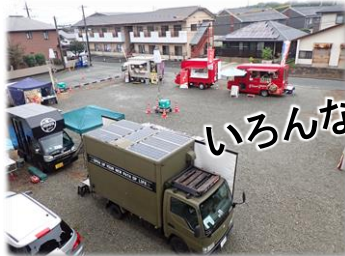
いろいろなイベントを準備