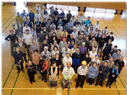
ご協力いただいた方 ありがとうございました