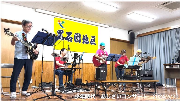
少年時代 あじさいコンサート 2024/6/30