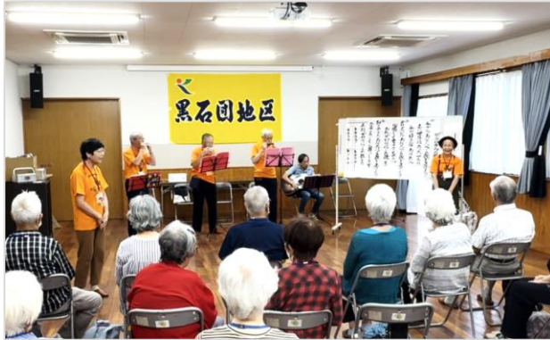
ピエロの会、たくさんのハーモニーを披露してくれました

くぬぎサロン主催の敬老のお祝い、美味しいご飯をみんなでおべ、楽しいイベントを鑑賞し楽しいひと時となった。くぬぎサロンのみなさま、お疲れさまでした。