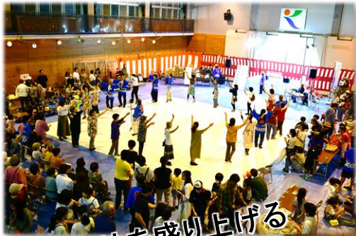
黒石団地を盛り上げる

十月十九日に黒石団地区の秋祭りが開催された。あいにくの天気となり場所をグラウンドから黒石体育館へ移し開催。体育館での開催は祭り始まって以来の初めての事であったが、区民の皆さまの協力のもと、無事に開催する事ができた。射的や金魚すくいなど子供が楽しめるイベント、からあげや焼きそばなど食が楽しめる出店やキッチンカーなど、充実した内容で笑顔あふれる祭りとなった。また、南阿蘇のエイサー隊、黒石団地の太極拳などの披露も祭りを盛り上げてくれた。合志市音頭を踊り、ラストは恒例の花火。雨が上がった秋の夜空に打ち上げられた花火を見ながら祭りはフィナーレを迎えた。