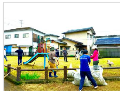
みんなで協力して持ち場を清掃