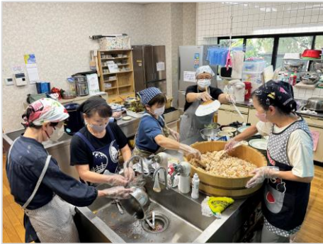
腕を振るって作る美味しい料理！