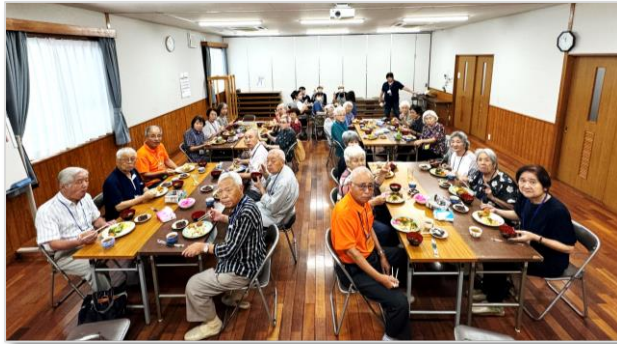
ワイワイとみんなで食事