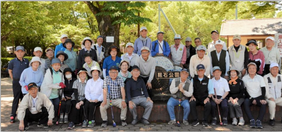
樹木版設置記念 黒石団地グラウンドゴルフ愛好会 公園管理