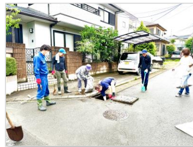
側溝に溜まった大量の泥をかき出しました

黒石団地区の一斉清掃が行われた。公園や道路、側溝などを中心に区民が協力して清掃を実施。引き続きみんなで協力してキレイな町を目指しましょう！