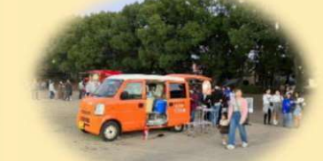
あつあつ たこやき