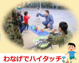
わなげでハイタッチ