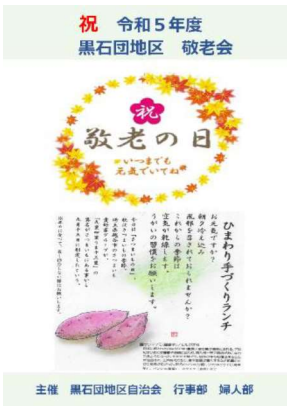
主催 黒石団地区自治会 行事部 婦人部