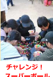
チャレンジ！スーパーボール