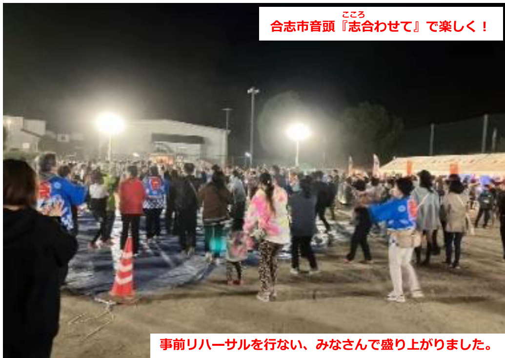
合志市音頭『志合わせて』で楽しく！