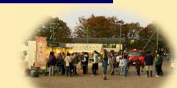
ジューシー からあげ