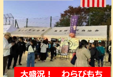
大盛況！ わらびもち