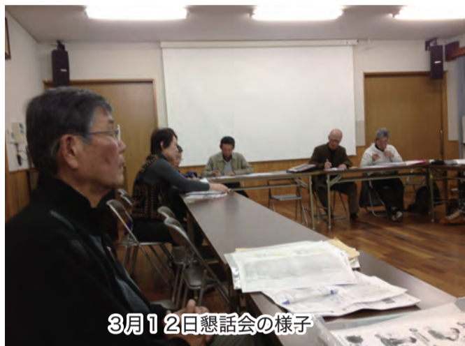
3月12日懇話会の様子