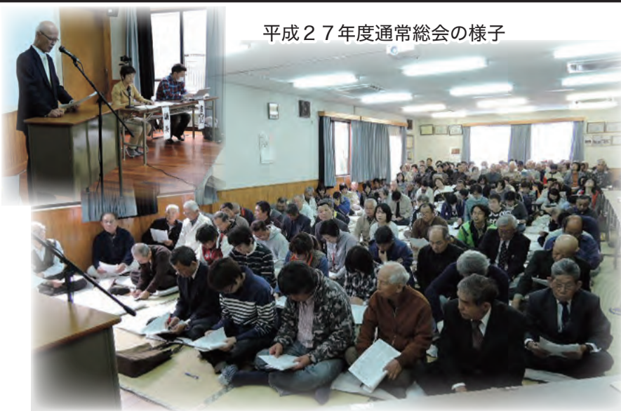
平成27年度通常総会の様子

二十八年度の通常総会を四月十七日(日)午前十時より開催致しますので、区民の皆さんのご出席をお願いいたします。 二十七年度は通常の各種行事に加え、自主防災組織作りの議論を重ねました。真摯な議論を続け十一月二十九日の臨時総会で区民の皆さんの承認を頂き、自主防災組織が発足しました。その後の年末夜警や今年三月の第五回総合防災訓練などで、自主防災組織の活動が確実なものになってきました。二十八年度では少子高齢化の影響が現実的となりつつあり、また子ども会や自治会ポランティア団体の活動に支障が出てきている問題などを議論して行きます。皆さんのご協力を宜しくお願いいたします。