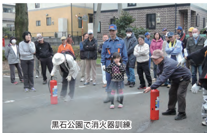
黒石公園で消火器訓練