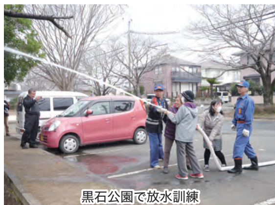
黒石公園で放水訓練