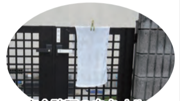
安全確認の白タオル

安否確認訓練集計の結果八十三% の八百二十五世帯を確認する事が できました。その内、白タオルを玄 関にかけていた世帯は五十六%で した。