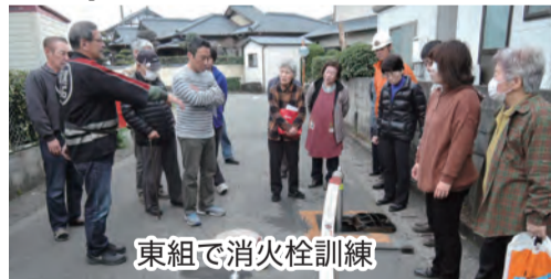
東組で消火栓訓練

今回は自主防災顧問の指導で各組毎 での消火設備点検、消火器訓練と消 火栓訓練を行いました。 班内の皆さんも熱心に訓練に参加さ れていました。 初めて消火設備 の中を見た方も いてとても良か ったと感想を頂 きました。 消火栓の蓋を開 けたり、消火設 備の取扱い方法 を皆さん熱心に 体験されていま した。もしもの時 に役立つ事と思 います。