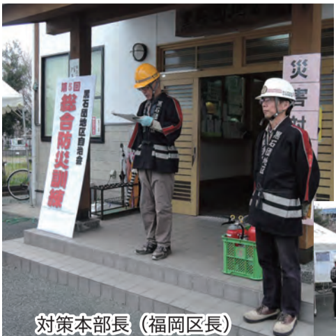
対策本部長 (福岡区長)