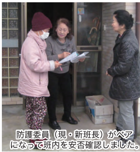
防護委員(現・新班長)がベア になって班内を安否確認しました。

防護委員(現・新の班長)がベアで班 内を回って安否確認訓練を行いました。 今回初めての試みとして、全員無 事の場合は白タオルを玄関近くにか けておく訓練を行いました。その結果 安否確認の所要時間が昨年の約半分 の時間で終了する事が出来ました。