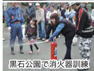
黒石公園で消火器訓練

今回は自主防災顧問の指導で各組毎 での消火設備点検、消火器訓練と消 火栓訓練を行いました。 班内の皆さんも熱心に訓練に参加さ れていました。 初めて消火設備 の中を見た方も いてとても良か ったと感想を頂 きました。 消火栓の蓋を開 けたり、消火設 備の取扱い方法 を皆さん熱心に 体験されていま した。もしもの時 に役立つ事と思 います。