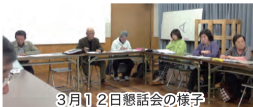
3月12日懇話会の様子

黒石団地区自治会も四十年で、区民の人口構成も変化していて、現在は合志市の中で一番高齢化しています。 したがって自治会の活動も見直し時期が来ている。まず意見が多かったのが行事が多すぎるという指摘でした。 区の行事を見直し、簡素化して手伝い出来る人ができる範囲で協力していただいて行事を継続させてはどうか。 また現役の子育て世代の参加を促すにはどうしたら良いかという事で、おやじの会などを作ってみてはどうか、行事の企画立案の際に子育て世代の意見を求めるなどの色々な意見が出ました。