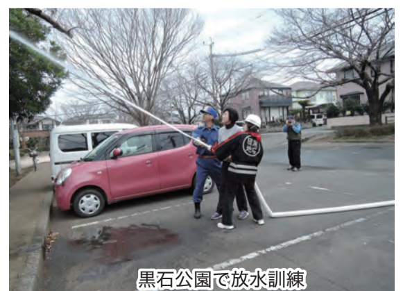
黒石公園で放水訓練