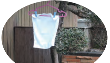
安全確認の白タオル