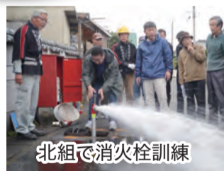
北組で消火栓訓練