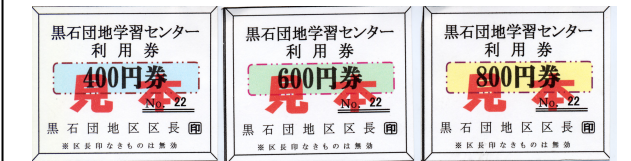
(公民館の利用券見本)

※公民館使用申し込みの時に、公民館主事より下の利用券を購入して下さい。 ※公民館使用後、使用簿を記入して、利用券は、利用券回収ボックスに入れて下さい。 ※定期的に使用されるサークルは、まとめて購入をお願いします。