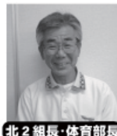
北2組長・体育部長