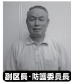
副区長・防護委員長