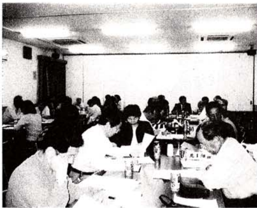
西合志町消防団操法大会

四月二十五日(日曜日)中央公園で町主催公設消防の操法大会(水出し放水)が開催されました。一位・須屋区・二位・役場本部・三位・上須屋区・堀川区でした。