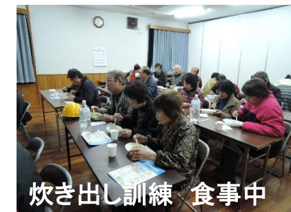
炊き出し訓練 食事中