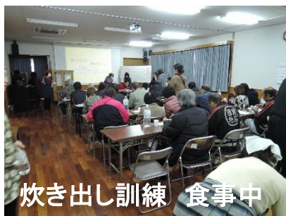
炊き出し訓練 食事中