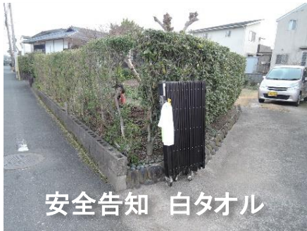
安全告知 白タオル