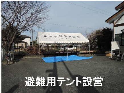
避難用テント設営