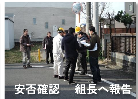
安否確認 組長へ報告