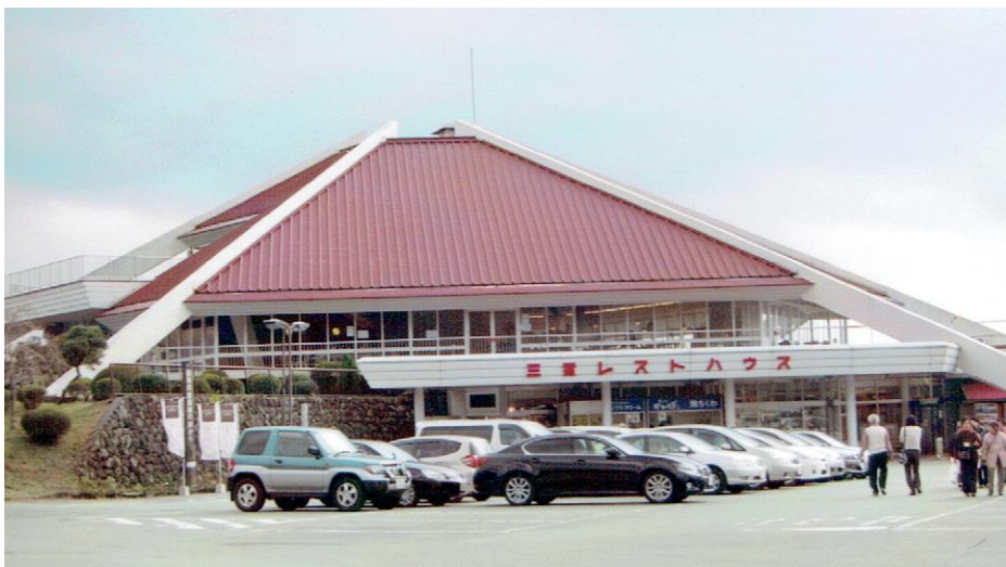
阿蘇瀬の本・三愛レストハウス