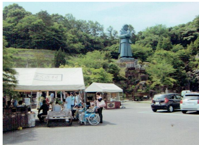
立ち寄り処 「藍のあまくさ村」