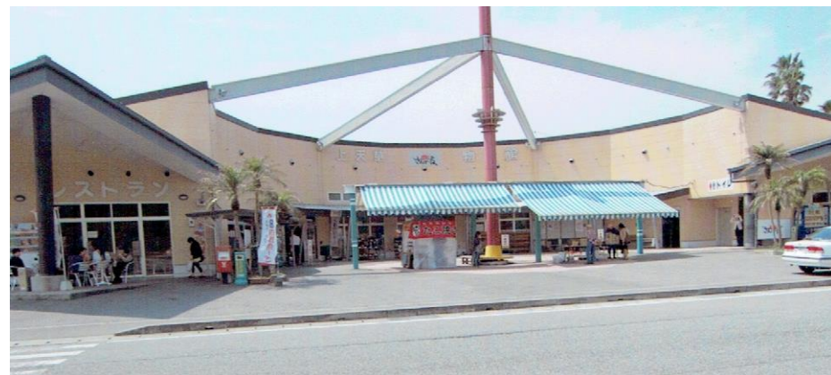
立ち寄り処「上天草物産館」